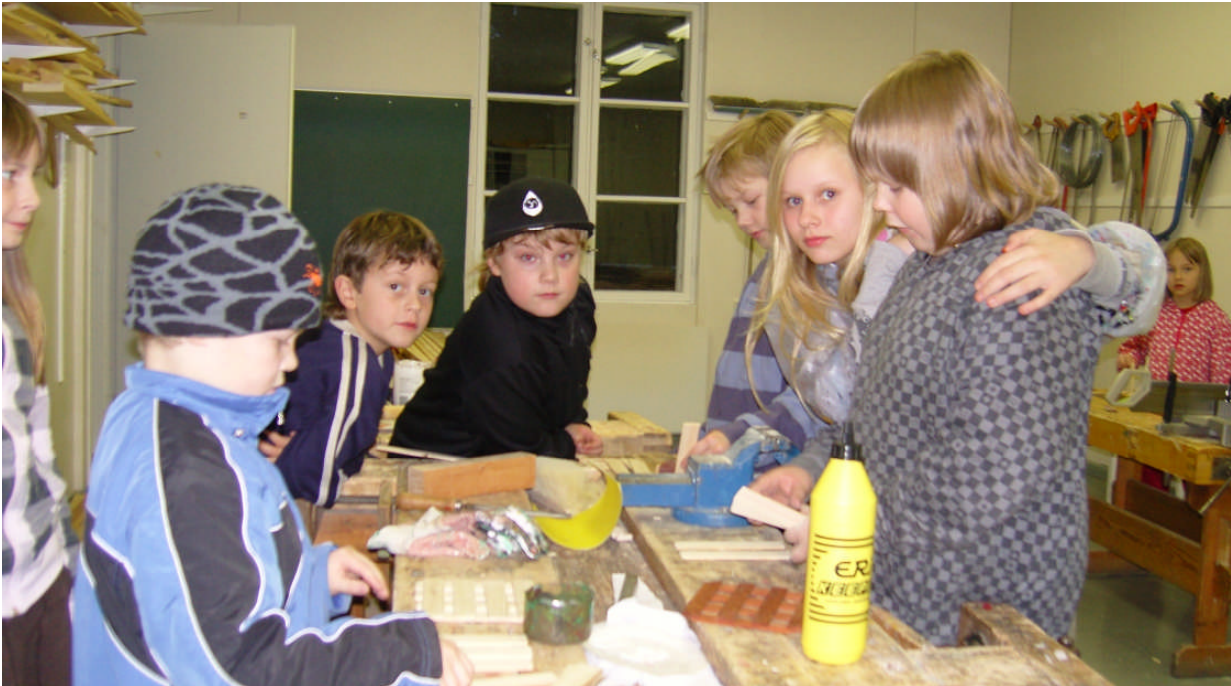
Kuhmon 4H-yhdistyksen Lentiiran kerhossa tehdään puukäsitöitä.

Kainuussa tehtiin vuonna 2009 TOP-tehtäviä A- ja B-tasolla 5198 kpl C-tasolla 568 kpl. Eniten tehtäviä tehtiin Koti- ja keittiö sekä Taitavat kädet -teemoista.