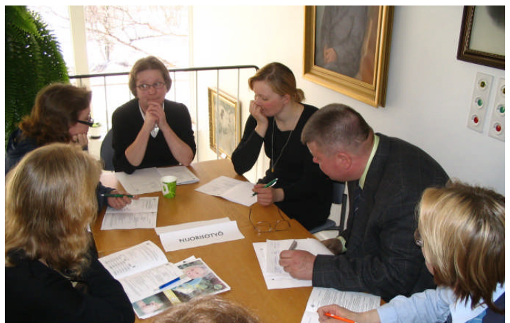
Nuorisotyön ryhmä kokouksessaan Ristijärvellä 25.4.2009.

Nuorten aseman vakiinnuttaminen ja innostaminen niin yhdistysten hallitustyöskentelyyn kuin toimintaryhmätyöhön vaatii vielä erityisponnisteluja niin yhdistyksiltä kuin piiriltäkin. Nuorten osallisuus nostetaan jatkossa yhdeksi pääteemaksi.