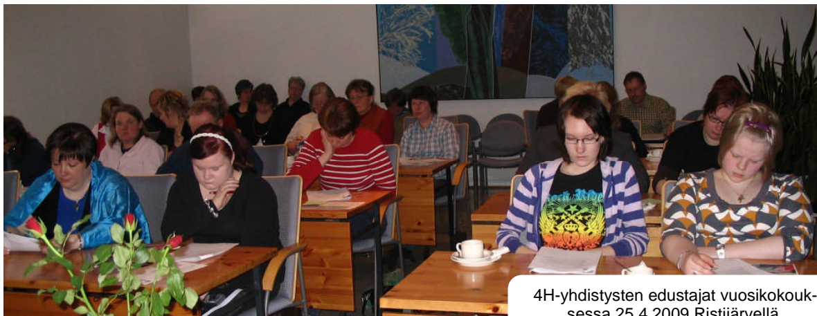
4H-yhdistysten edustajat vuosikokouksessa 25.4.2009 Ristijärvellä.